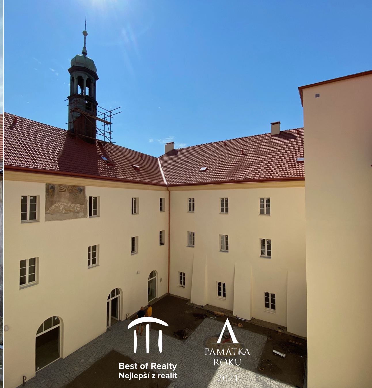
Domov Klášter Senlife Mělník otevřen v srpnu 2021 (rekonstrukce probíhala 10 měsíců)