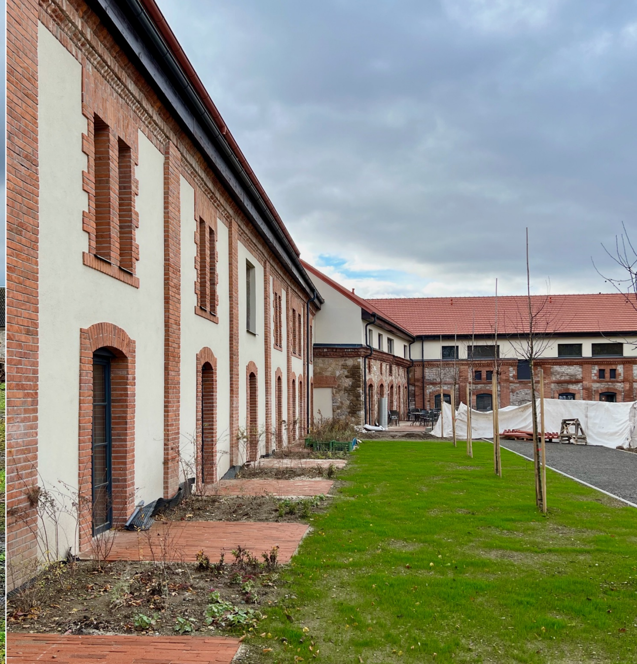
Domov Zámek Tmaň (okres Beroun) s plánovaným otevřením v listopadu 2023